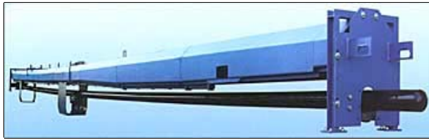
Soot Blowers are used for boiler maintenance