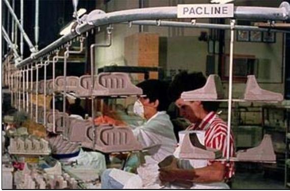
Enamel Drying Conveyor - Sirlama kurutma konveyör