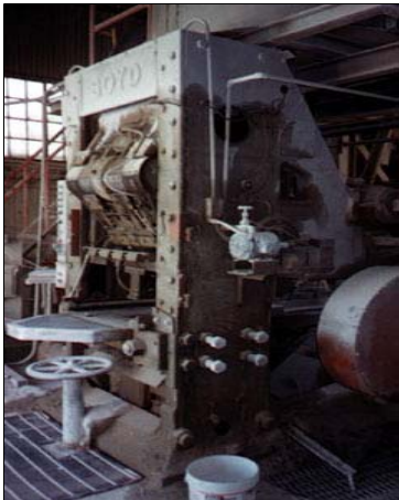
← Hydraulic Brick Press Hidrolik briket pressi

6000 – 7000 atü lük basınçlarda çalışan hidrolik veya mekanik,ekstürizyon sıkıştırma ve presleme ünitelerinde ;