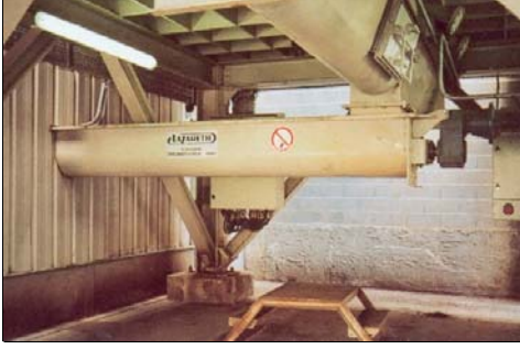
← Screw conveyors Helezon – vidalı konveyörler →

Depolardan alınan ham maddeler helezon-vidalı konveyörler ile döküm odalarına taşınıyor.