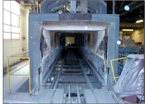
Fırın tüneli - Tunnel Kıl