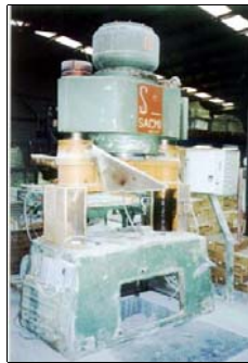
→ Tile Presses Tuğla presleri