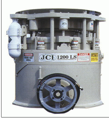
Konik kırıcı ← Cone Crusher